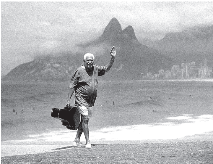
O baiano Dorival Caymmi diante da lente poética do conterrâneo